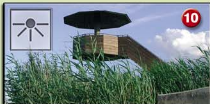
10 PONT DEL TRAVÉS (Parasol. 3m. 1994) Ambients naturals: bassa i canyissars. Aus més característiques: fotges, ànecs, cabussos, rapinyaires, ardeïds, flamencs, gavines i fumarells.