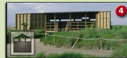
4 GARXAL ITINERARI (Aguait. 2001) Ambients naturals: bassa i salobrar. Aus més característiques: ànecs, ardeïds i limícoles.