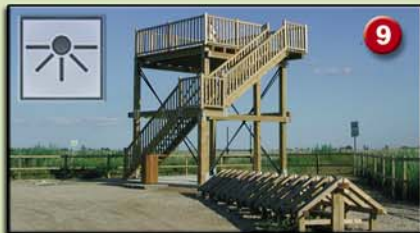
9 L'EMBUT (Plataforma. 4,5m. 2002) Ambients naturals: bassa, canyissars i arrossars. Aus més característiques: fotges, ànecs, rapinyaires, ardeïds i polles d'aigua.