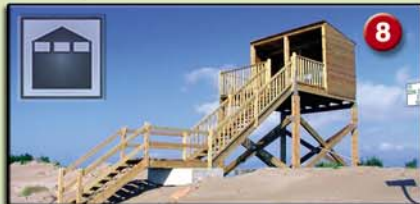
8 PUNTA DE LA BANYA-SALINES (Mirador. 3m. 2002) Ambients naturals: platja, arenal, salobrar, dunes i salines. Aus més característiques: flamencs, gavines, xatrac, i limícoles.