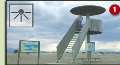
1 EL FANGAR (Parasol. 3m. 1995) Ambients naturals: platja, dunes mòbils i fivers. Aus més característiques: gavines, limícoles i xatrac.