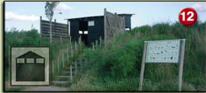
12 CARRETER (Aguait. 2m. 1995) Ambients naturals: bassa, canyissars i arrossars. Aus més característiques: fotges, ànecs, rapinyaires, ardeïds i polles d'aigua.