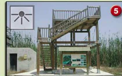
5 CANAL VELL (Plataforma. 4,5m. 2001) Ambients naturals: bassa, canyissars i arrossars. Aus més característiques: fotges, ànecs, ardeïds i fumarells.