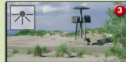
3 PLATJA RIUMAR (Parasol. 3m. 1997) Ambients naturals: platja i dunes amb vegetació. Aus més característiques: gavines, xatrac i limícoles.