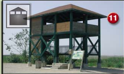
11 CASA DE FUSTA (Plataforma. 6m. 1995) Ambients naturals: bassa, canyissars i arrossars. Aus més característiques: fotges, ànecs, cabussos, rapinyaires, ardeïds, flamencs, gavines i fumarells.