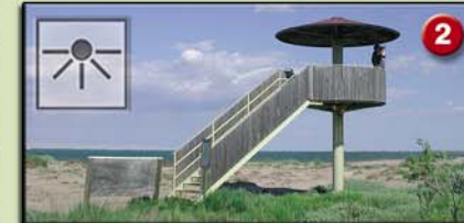
2 LES OLLES (Parasol. 3m. 1993) Ambients naturals: bassa, platja, dunes, salobrar, badia i arrossars. Aus més característiques: ànecs, limícoles, ardeïds i fumarells.