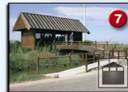
7 LA TANCADA (Mirador. 1996) Ambients naturals: bassa, salobrar i arrossars. Aus més característiques: flamencs, corb marins, ànecs i fotges.